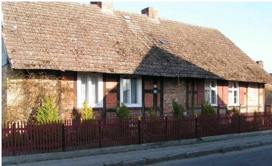
Rysunek 3 Zabytkowy dom przy ulicy Kolejowej

Według danych z 1809 r. w Górkach był sołtys, 32 chłopów, 7 zagrodników, 6 wolnych ludzi, 5 chałupników, 36 komorników, 1 chłop kościelny, 3 karczmarzy, kowal, leśniczy; łącznie 515 ludzi na 43 łanach i w 46 domach. Natomiast spis z 1813 r. podawał liczbę 392 ludzi w 54 budynkach. Oprócz 32 gospodarzy było 7 chłopów małorolnych, 6 starszych chałupników i 2 kowali. Ważnym wydarzeniem dla mieszkańców Górek było otwarcie w październiku 1857 r. linii kolejowej. Stacja znajdowała się w odległości 1,5 km od wsi.