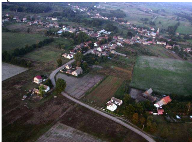
Rysunek 4 Górk>Noteckie z lotu ptaka

Krajobraz okolic Górek Noteckich ukształtował się około 12 tysięcy lat temu w wyniku działalności lodowca bałtyckiego, a szczególnie w trzeciej fazie zwanej stadią pomorską. Wykształconą w tym czasie rzeźbę, zawierającą świeże formy polodowcowe, nazywamy młodoglacjalną lub młodolodowcową. Na południe od ciągu pagórków moreny czołowej oraz na północ od szosy Górk-Zwierzyn ciągnie się wąski pas strefy zandrowej. Zandr zwany gorzowskim lub barlineckim, dociera od zachodu aż do Zwierzyna. W zandrze przysypane piaskiem lub żwirem tkwią fragmenty moreny dennej starszego zlodowacenia. Na południe od Kanału Otok (Rana) rozciąga się Pradolina Toruńsko - Eberswaldzka. Jest to rozległe obniżenie o charakterze równiny zalewowej z aluwów, które odzwierciedlają jej dzieje od czasów postoju lądolodu.