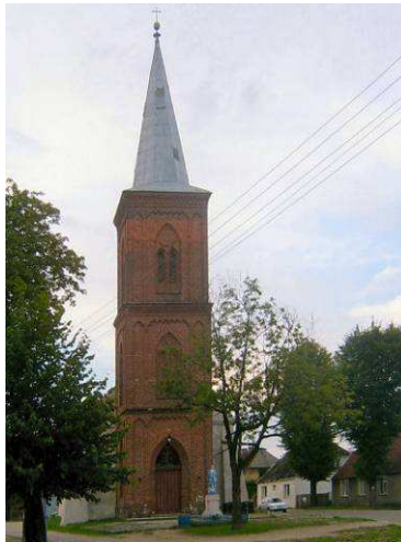
Rysunek 1 Kościół pod wezwaniem NP NMP