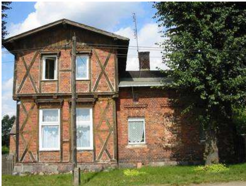
Rysunek 2 Zabytkowy dom przy ulicy Santockiej