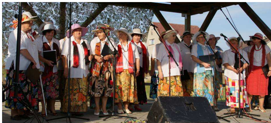
Rysunek 8 Zespół śpiewaczy "Górkowianki"

Zespół Śpiewaczy „Górkowianki” od wielu lat uświetniający przeróżne uroczystości, np.: na Przegląd Piosenki Kresowej w Gorzowie Wlkp., Szparagowe Żniwa w Trzcielcu, dni Gminy Zwierzyn, Powiatowe Dni Seniora, Przegląd Kolęd i Pastorałek w Dobiegniewie, dożynki i inne wydarzenia. Rocznie „Górkowianki” dają 10 – 12 występów. Dotychczas chór wydał dwie płyty: „Górkowianki” z piosenkami biesiadnymi, dożynkowymi i patriotycznymi a drugą „Czas kolęd” z kolędami. Wielokrotnie zespół był nagradzany i wyróżniany. Istnieje już ponad 20 lat. Należy do niego ponad 20 osób.